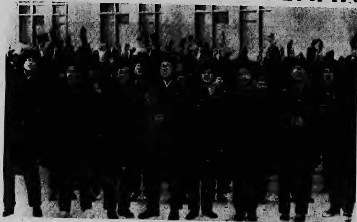
Mientras qu nan tabata zwaal cu boeklanan di e pensamientonan di Mao Tse Tung dilanti di nan embahada na Moscu, nan tabata spera riba permiso di autoridadnan a pone un ofrenda na tumba di Lenin. E permiso a ser nenga. Pero e chinesnan a keda hasi mes tantu bochircha.

Tambe e orden ta bisa cu e estudiantenan mester studia matematica, quimica, fisica, lengnan stranjo y otro temanan cu ta ser considera necesario, ademas di esey nan mester par-